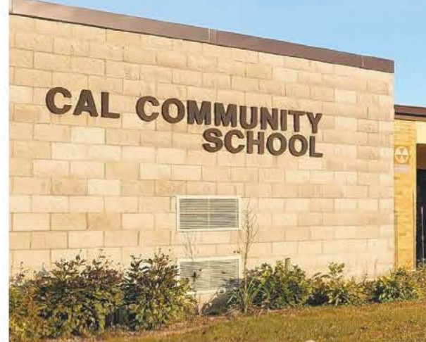
Un acuerdo que se haría efectivo el próximo año escolar, permitiría a la guarderia Cub Cadet permanecer en su edificio actual, pero utilizar parte de la escuela CAL para los niños mayores.