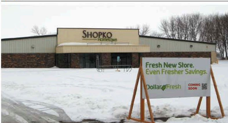
HyVee anunció a finales de enero que pretende abrir una tienda Dollar Fresh en el edificio que anteriormente era ocupado por Shopko en Hampton.

Sprague dijo que la tienda ofrecerá una completa selección de artículos comestibles, productos de panadería y pastelería frescos, una sección de frutas y vegetales, un área de productos a dólar, una "muralla de valor" con artículos de la marca privada HyVee y una selección de comidas preparadas.