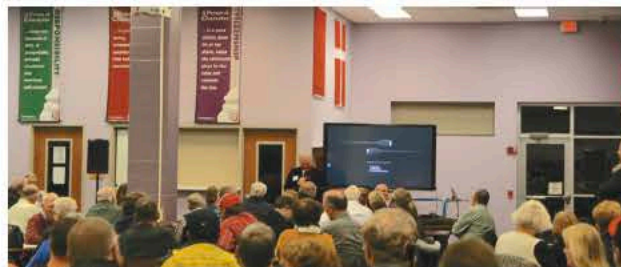
Más de 150 votantes y candidatos se reunieron en el centro de computación de la Escuela Secundaria Hampton-Dumont-CAL para el Caucus Republicano del Condado de Franklin el lunes por la noche.