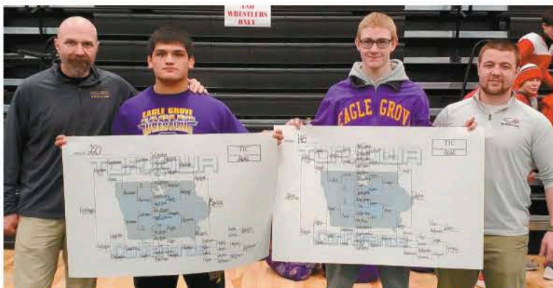
Mendoza y Dawson con sus entrenadores, ambos campeones de la conferencia después de haber luchado en el torneo final de los Mejores de Iowa.

Dawson dijo no tener idea de estar tan cerca de la victoria número 150 hasta que su padre le dijo.