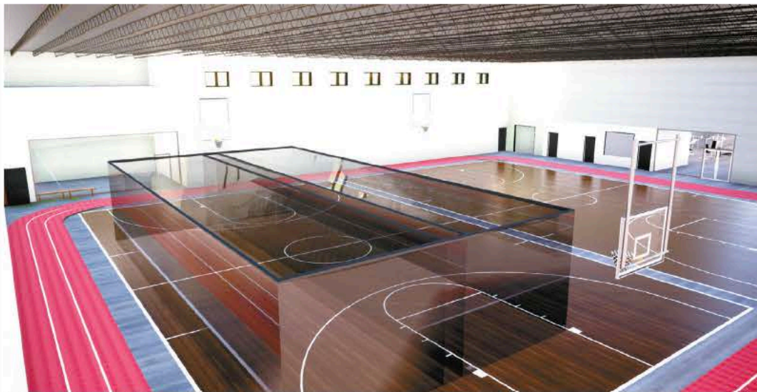
La ampliación del Wellness Center de Eagle Grove incluirá dos canchas de baloncesto, una sala de pesas ampliada, cancha de pickleball/racquetball, entre otros. REPRESENTACIÓN COMPUTACIONAL ENVIADA

"Muchas compañías en el área tienen empleos que quizá no sepamos que existen," dijo. "No es sólo en una cierta área, pero existen varios empleos, y también distintos departamentos en una misma compañía." ■