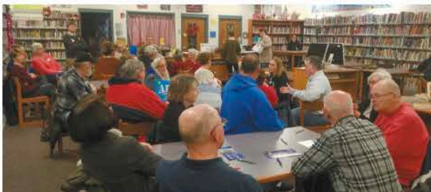
Demócratas del área se reunieron en la Escuela Intermedia Hampton-Dumont el lunes para participar del Caucus de Iowa.