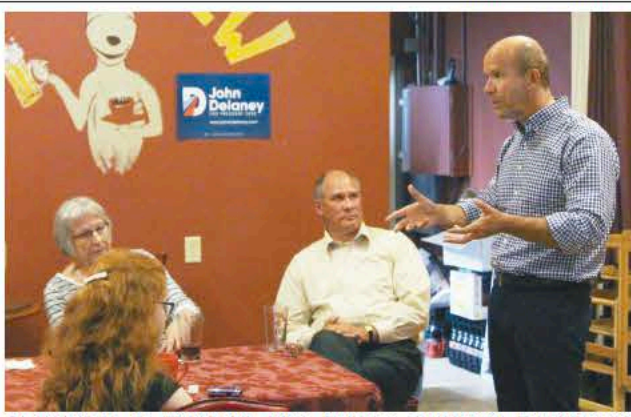
Congresista de Maryland John Delaney, candidato Presidencial Demócrata para las elecciones del 2020, pasó por Rustic Brew en Hampton el jueves 8 de agosto.