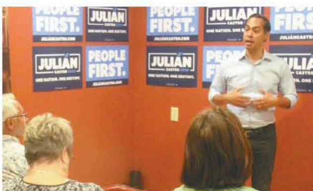
Candidato Presidencial Demócrata Julian Castro visitó Rustic Brew en Hampton el viernes 9 de agosto, antes de dirigirse a la Feria Estatal de Iowa y al Wing Ding Demócrata en Clear Lake.