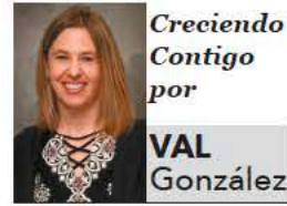
Creciendo Contigo por VAL González

Después de que hayas enviado solicitudes y recibido las cartas de aceptación, o incluso confirmado tu inscripción a una universidad particular, el